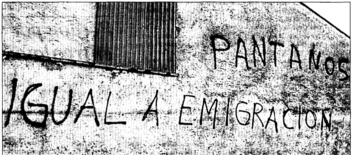
Una de las pintadas que afloran en la Alta Zaragoza en contra del recrecimiento. Abajo, dos mujeres de Artieda enviando cartas para pedir apoyos