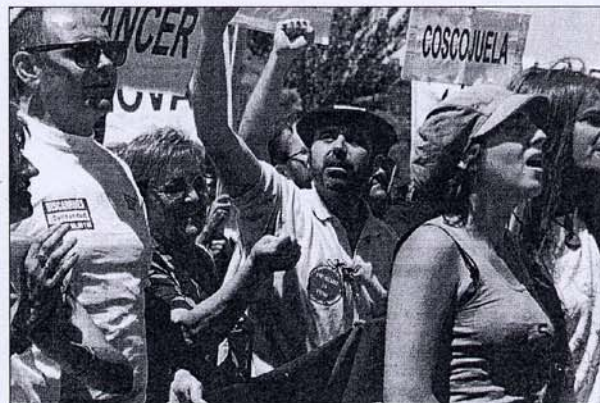
Jóvenes. Su presencia dió un enorme dinamismo a la manifestación.