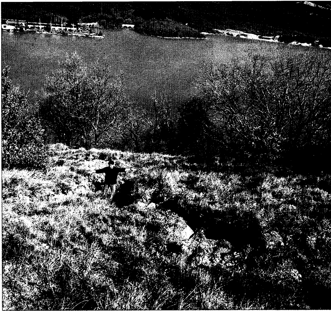
El alcalde de Artieda, en una de las espectaculares grietas. S.E.